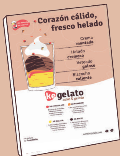
Expositor de mostrador